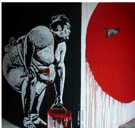
Jef Aérosol, Sumo, Tokyo, 2009

Une version "prestige" avec, en plus du coffret luxe, une sérigraphie de Jef Aérosol format A3 sur papier velin (série limitée et numérotée à 200 exemplaires) est également disponible.